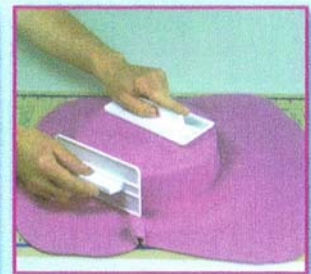
Eindecken eines runden Kuchens. Man braucht ca. 600g Fondant pro Ober- und Unterteil.